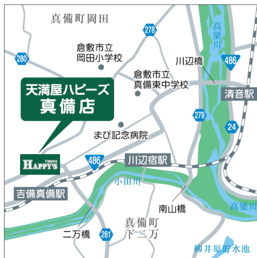
< 広 域 >