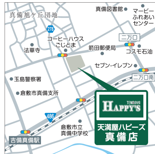
< 近 隣 >