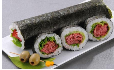
ローストビーフ巻き