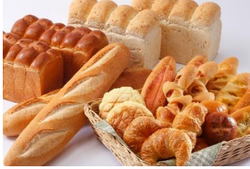
おかやまキムラヤ