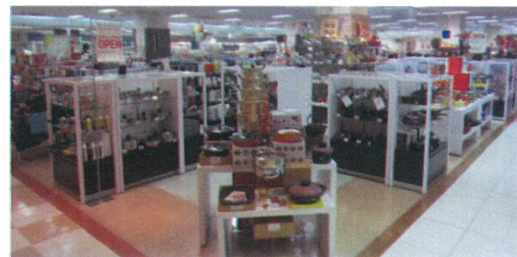
生活雑貨コーナー